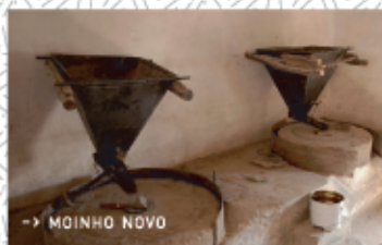
→ MOINHO NOVO

O Pólo da Biblioteca Municipal assinala o início deste trajecto pelos campos da freguesia de S. Pedro do Esteval. Siga em direcção às povoações de Picoteira Fundeira e de Picoteira do Monte. Mais à frente, assiste-se à confluência entre a Ribeira da Pracana e a da Freixada. Este encontro entre linhas de águas, propícias a actividades piscatórias, é a parte mais bela do percurso. Aprecie o Moinho Novo, um açude que foi reabilitado e ainda hoje é utilizado. Mais adiante, como dizem por estas terras, encontrará a Azenha das Brazinhas, cujas ruínas de um açude em xisto e de um velho lagar nos transportam para tempos em que estas terras eram bastante povoadas e trabalhadas. Seguindo pela margem da Ribeira da Pracana e com a Serra de Mação como cenário, chega-se à Ponte da Ladeira. Ao lado, atravesse a Ponte Romana, fronteira entre os concelhos de Proença-a-Nova e de Mação. A pouco mais de 1 km deste local, e após uma pequena subida, avista-se o cemitério, o ponto mais altaneiro de S. Pedro do Esteval, que oferece uma vista privilegiada sobre este quadro rural. À medida que se prossegue o percurso, outros pormenores desta "terra entre estevais" surgem-nos perante os olhos como se fosse um presépio. Avista-se a cúpula da Igreja Matriz de S. Pedro, algumas casas, em contraponto à Serra de Mação, que fica para trás.