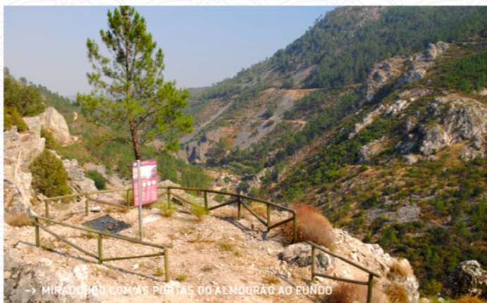
-> MIRADOURO COM AS PORTAS DO ALMOURÃO AO FUNDO

O percurso tem início em Sobral Fernando, a aldeia que assinala o início a sudeste do concelho de Proença-a-Nova. Separada da vizinha Foz do Cibrão, concelho de Vila Velha de Ródão, pelo Rio Ocreza, esta povoação de casario de xisto e de paredes caiadas de branco vale pela hospitalidade e simplicidade das suas gentes, sempre dispostas a dar informações, caso as solicite. Prepara-se para a caminhada porque os seus olhos vão perder-se numa das paisagens mais belas da região. Depois de deixar a aldeia, irá percorrer um pequeno pinhal, onde a sombra e o aroma das árvores lhe servem de ânimo. À medida que começa a subir, é a vista magnífica sobre as aldeias de Sobral Fernando e Foz do Cibrão, arrumadas pelo Homem nas encostas da Serra das Talhadas, com o Rio Ocreza ao fundo, que domina as atenções. A cerca de 1,3 Km, pare nos miradouros, onde estão disponíveis informações sobre a história e a biodiversidade deste lugar selvagem. Com três pontos de observação estratégicos, sinta a altivez das encostas escarpadas do Vale Mourão, uma garganta escavada pelo Rio