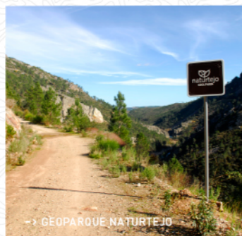
-> GEOPARQUE NATURTEJO

A vegetação frondosa, composta por plantas tão variadas como a esteva, os juncos, os fetos selvagens, os tojos ou o rosmaninho, e a frescura dos pinheiros serve de alento na fase final do trajeto. Passados 6,5 Km, chega-se, finalmente, a Carregais, uma aldeia pitoresca, cujas fachadas das casas, ora em xisto ora pintadas de branco, jogam com o verde e o vermelho dos pomares de cerejeiras, que em maio, junho e julho emprestam a cor a este lugar protegido pela serra. Nos meses frios de inverno, cheira ao fumo das lareiras e dá-nos vontade de permanecer mais tempo do que nós é permitido.