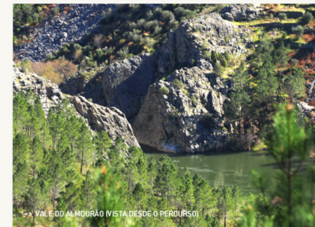
-> VALE DO ALMOURÃO (VISTA DESDE O PERCURSO)

Com uma vista imponente, onde nos sentimos pequenos, o Vale Mourão (ou Vale do Almourão) é um lugar inóspito e de difícil acesso. Caminhar no interior deste desfiladeiro com 400 metros de profundidade é viajar no tempo quase 500 milhões de anos, até uma era em que os duros quartzitos eram finas areias depositadas no fundo de um vasto oceano. Foram necessários uma mega colisão e 140 milhões de anos para transformar estes sedimentos em rochas metamórficas, e erguê-los dos fundos marinhos aos cumes das montanhas. A paisagem impressionante que hoje encontramos é o resultado de 250 milhões de anos de alteração química das rochas e da erosão ao longo de tempos inimagináveis.