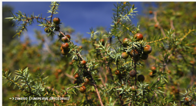
-> ZIMBRO [ JUNIPERUS OXYCEDRUS ]

Pelas encostas escarpadas, subsiste uma área considerável de zimbrals, sobre solos rochosos de quartzitos, muitos fraturados, com escassa retenção de água, que se escoam facilmente para o subsolo, logo, tem que suportar uma seca estival mais prolongada. Nestas comunidades que incluem espécies termófilas, os zimbrals ( Juniperus oxycedrus ) não ostentam porte arbóreo, constituindo matagais mais ou menos densos. Com uma presença particularmente relevante, o zimbro é uma espécie-reliquia e rara que terá tido a sua grande expansão até há dois milhões de anos, adaptada a um clima de características mediterrâneas, mas muito seco e frio.