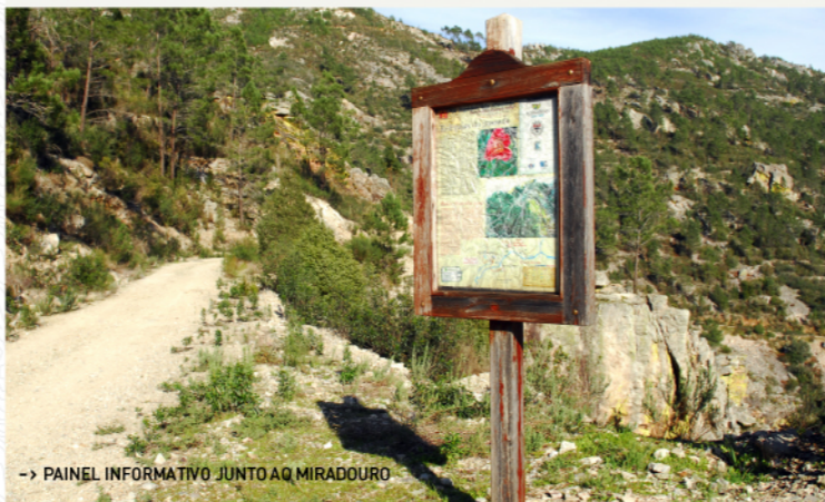
-> PAINEL INFORMATIVO JUNTO A Q MIRADOURO