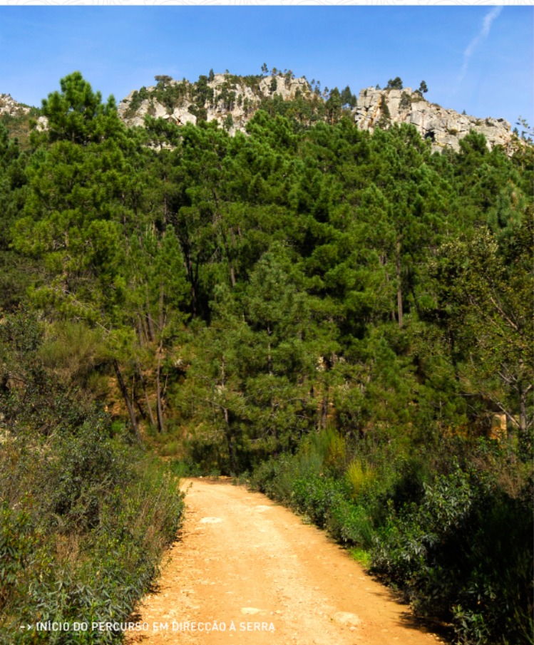
-> INÍCIO DO PERCURSO EM DIRECÇÃO À SERRA

Ocreza nos últimos dois milhões de anos, que parte a Serra das Talhadas em duas cristas quartzíticas. Em silêncio, pode observar os grifos, que tanto repousam nas rochas como planam o céu azul. Um pouco mais à frente, a 2,3 Km do percurso, deixe-se fascinar pela imponência das Portas do Vale Mourão.