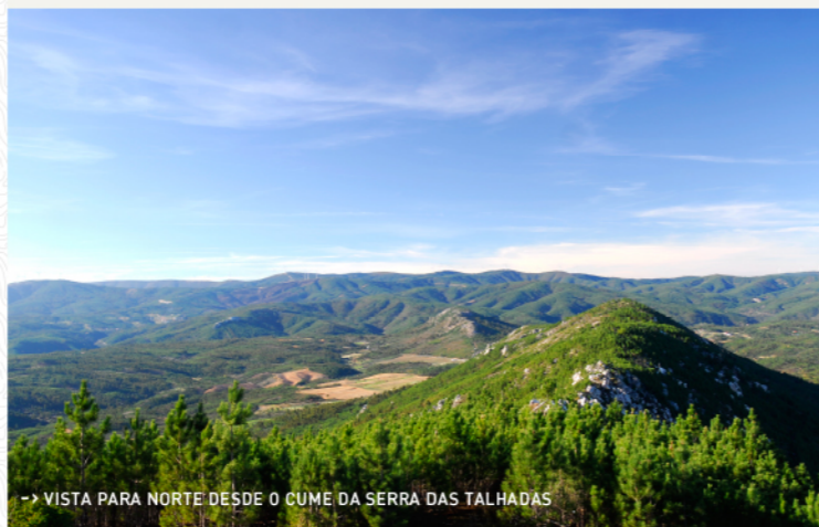
-> VISTA PARA NORTE DESDE O CUME DA SERRA DAS TALHADAS