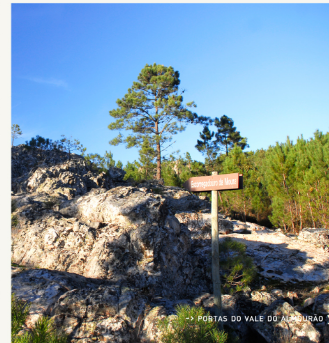
-> PORTAS DO VALE DO ALMOURÃO

Reza a lenda que num buraco aberto dos afloramentos da serra, voltado a nascente, vivia uma moura encantada com poder para transformar objetos em ouro. A dois passos deste lugar, existe uma placa quartzítica onde a bela encantada se banhava, que ficou conhecido como o Escorregador da Moura. Ao passar por estes locais, pode ser que tenha a sorte de ainda a encontrar.