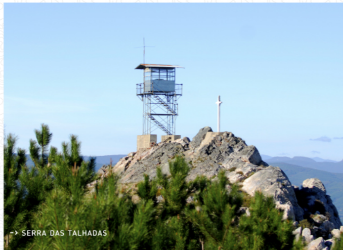
→ SERRA DAS TALHADAS