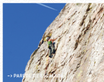
→ PAREDE DE ESCALADA