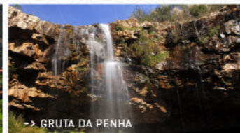
→ GRUTA DA PENHA